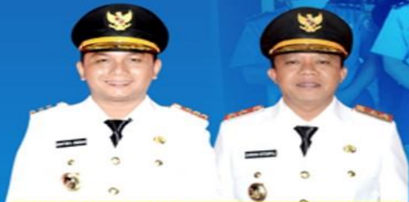
BAKHTIAR AHMAD SIBARANI BUPATI TAPANULI TENGAH

UPDATE DATA PASIEN PADA TANGGAL 23 MEI 2020